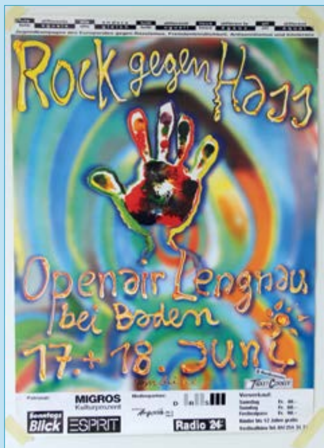
Die Hand von «Rock gegen Hass» ist ein Statement für Akzeptanz und Toleranz.

Namhafte Schweizer- und internationale Künstler/innen haben sich für eine Schweiz mit Herz und für gegenseitige Toleranz engagiert.