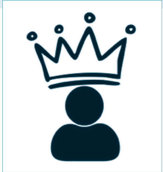
Tegerfelden sucht eine neue/n Wykönig/in.

Neugierig? Dann melde dich. Vielleicht passt es besser, als du denkst. Bezug zu Tegerfelden und zur Weinbautradition, Amtsdauer: 2 Jahre, Gage: CHF 1'000 + Einkleidung, Anmeldeschluss: 30. Juni 2026 . Weitere Infos und Anmeldung: www.wysonntig.ch .